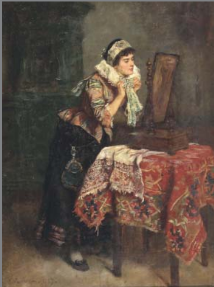
Karl Becker Vor dem Spiegel, 1887 Öl/Leinwand, 63 x 47,5 cm

Ausstellung vom 17. November 2011 bis 18. März 2012