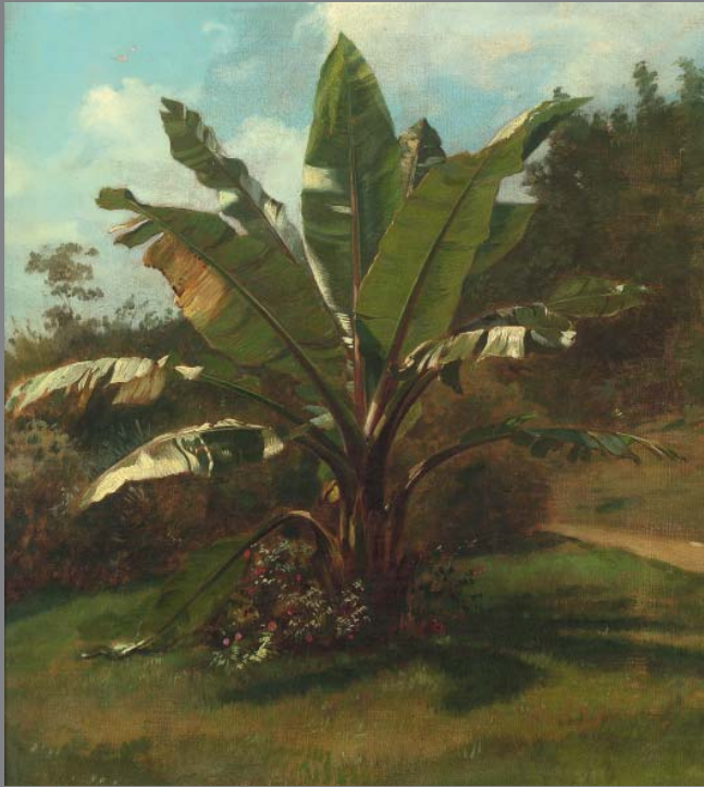
Oskar Begas, Bananenstaude, 1878, Öl/Leinwand, 71 x 64 cm