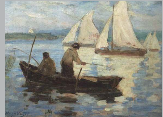
Hugo Vogel, Auf dem Wannsee, 1922, Öl/Karton, 43 x 58 cm

Die Ausstellung zeigt eine erstaunliche Vielfalt künstlerischer Positionen aus acht Jahrzehnten, angeregt durch die Schönheit der Wannsee-Potsdamer Kulturlandschaft.