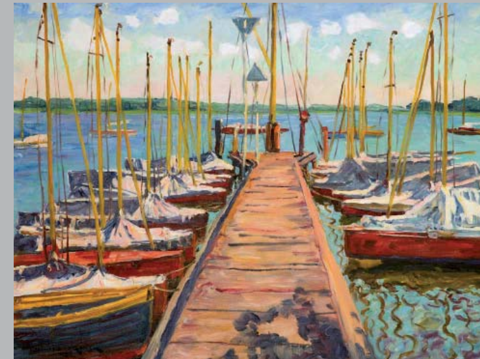
Philipp Franck, Bootssteg, 1934, Öl/Leinwand, 75 x 100 cm